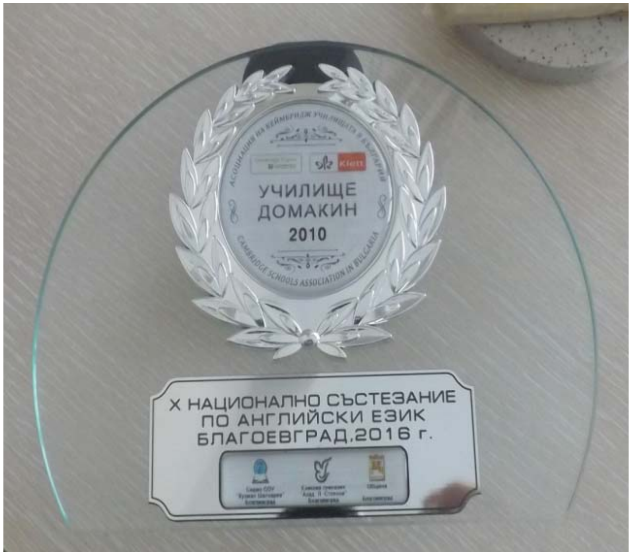
Плакетът за домакинство